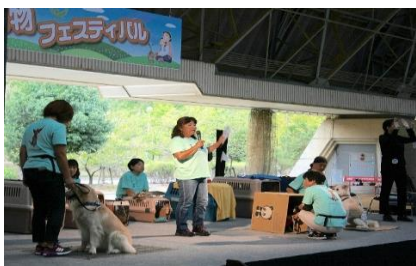
2016 しが動物フェスティバル