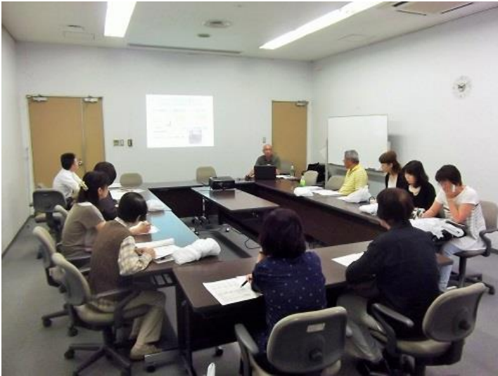
メモを取りながら熱心に受講していただきました

犬のニーズ(健康管理、食事、快適な居場所の提供、社会的なかわり など)や学習理論(犬の考え方、しつけや問題行動への役立て方など)、マナーアップ(リードの持ち方、マーキング対策など)や迷子にしないために(首輪やリードの点検、迷子札の装着など)の内容で約1時間講習を行った後、参加者から質問を受け付けました。